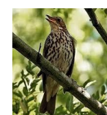
La Grive musicienne