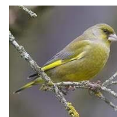
Le Verdier d'Europe